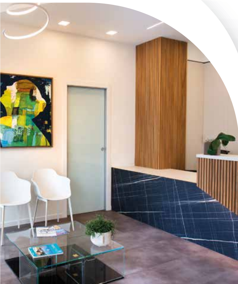
NUOVO UFFICIO RINNOVATO... VENITE A TROVARCI

OTTIENI L'IMMOBILE DEI TUOI SOGNI AD UN PREZZO VANTAGGIOSO... NOI TI SEGUIREMO PASSO DOPO PASSO