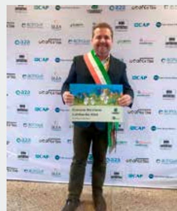
Foto dedicate alla natura di Almè per l'ecocalendario 2025